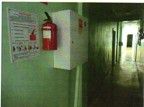
Фото № 4