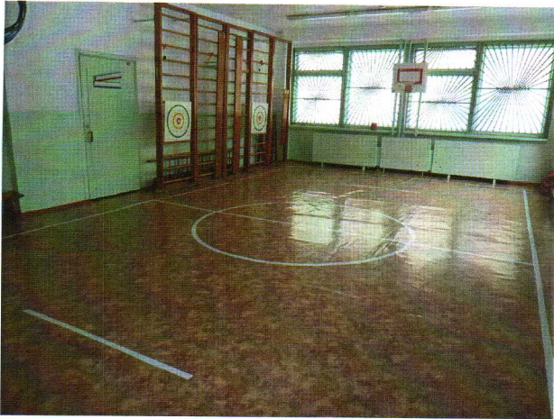
Фото № 7