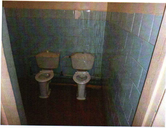
Фото № 9